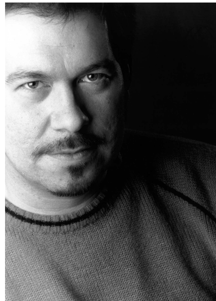
Éditeur : DARGAUD Nom de l'auteur : DELABY Prénom de l'auteur : PHILIPPE Copyright : © 2002 / DARGAUD

Néron en a rêvé. Lucius Murena l'a fait : incendier Rome. Tous, patriciens et plébéiens, cherchent à fuir et à protéger leurs proches. Désespérés, certains se jettent dans le Tibre tandis que d'autres préfèrent se livrer aux flammes. Les plus chanceux réussissent à atteindre le Champ-de-Mars. Le quartier du Transtibérin, lui, est épargné par les flammes. C'est là que vivent les chrétiens qui, avec Murena, tentent de venir en aide aux habitants. Mais l'infâme Tigellin les désigne comme coupables.